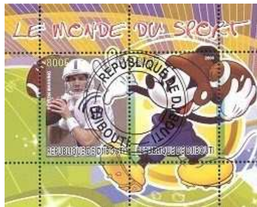
Football américain et illégaux