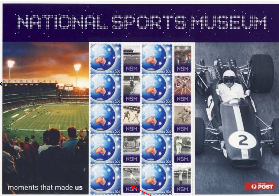
Australie : émission pour le Musée du sport en 2008

Ce feuillet n'est plus disponible auprès de la poste australienne. Un timbre reprend une photo d'une phase de rugby (XV ou XIII ??)