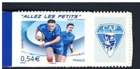
France : timbres personnalisés : Périgueux

Brive : ce dernier a été émis par le club philatélique briviste : je ne sais pas s'il reste des exemplaires disponibles