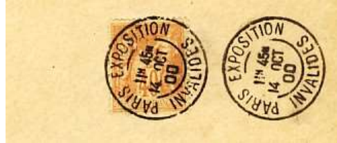
Oblitération Paris exposition du 14 octobre 1900, date du match France Allemagne sur enveloppe ayant circulée