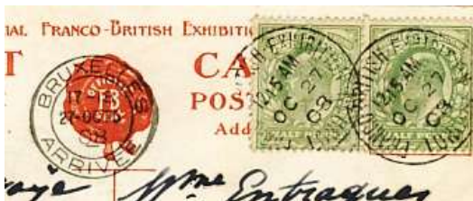
Grande Bretagne : oblitération de la Franco-British Exhibition du 27 octobre 1908

En 1908, Les Jeux Olympiques ne sont pas encore organisés en tant que tel, les épreuves se déroulent dans le cadre de l'exposition Franco-Britanniques de Londres. L'Australie s'étant déplacée avec ses joueurs de rugby, les organisateurs décident d'inscrire le rugby au programme : la Grande Bretagne désigne pour la représenter l'équipe championne des Comités (la Cornouaille – Cornwall) pour disputer un match qui sera la finale : l'Australie bat la Grande Bretagne le 26 octobre par 32 à 3.