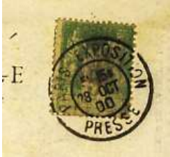
Oblitération Paris exposition Presse du 28 octobre 1900, date du match France Grande Bretagne sur carte ayant circulée

La compétition se déroule à Vincennes du 14 au 28 octobre et les Parisiens battent les Allemands par 27 à 17 le 14, et les Anglais par 27 à 8 le 28. : ils sont champions olympiques. La France est emmenée par son joueur phare Frantz Reichel