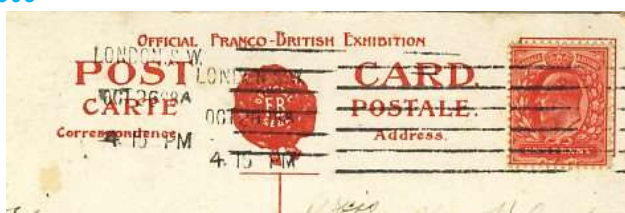
Carte de Londres pour Paris 26 octobre 1908, date du match Angleterre-Australie sur carte ayant circulée