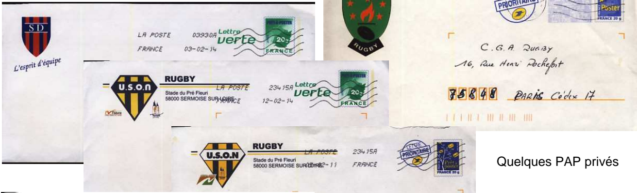
Quelques PAP privés