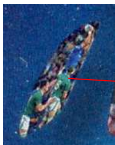
Ce timbre a été émis en feuillet de 10