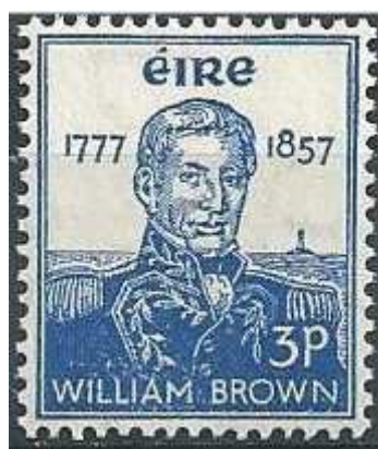
Yvert et Tellier N° 132 (Irlande 1957)