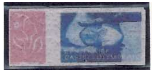
Timbre réalisé en hostie par un pâtissier de Castres