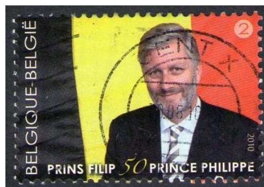
Belgique N° 4016 (2010)