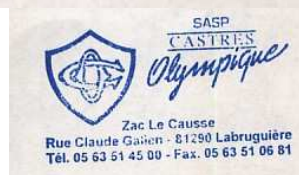
Version 2013, sans aucune indication sur l'empreinte. Enveloppe logotée avec la nouvelle adresse : ZAC Le Causse Rue Claude Galien 81290 LABRUGUIERE