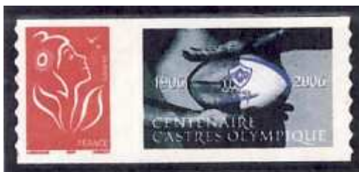
Timbre personnalisé émis en 2006 par l'Amicale Philatélique de Castres