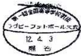
03-04-2000 Kumagaya : 1 er inter higschools selected rugby games