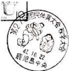
22-10-1972 : 27 e meeting national