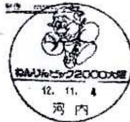
04-11-2000 Osaka : 13 e National Healt Welfare festival